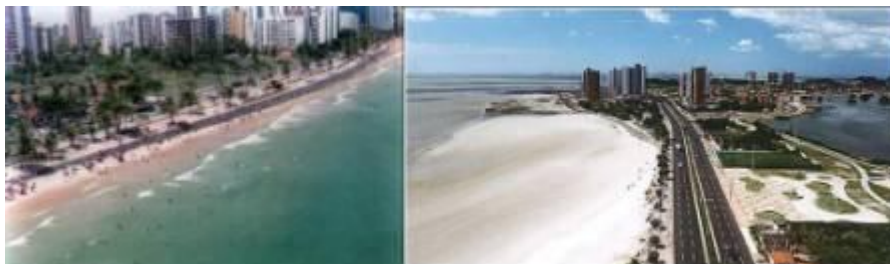
São Luis do Maranhão, cenário do Encontro da RedeJur

Depois de muita preparação e expectativa, é chegado o momento de associados, clientes, autoridades e empresários confraternizarem e, claro, aproveitarem as oportunidades de negócios do 22º. Encontro da RedeJur. Desta vez, a cidade de São Luis do Maranhão foi escolhida para brindar este encontro com sua beleza e importância no cenário nacional.