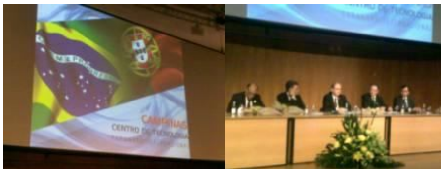
Missão empresarial consolida RedeJur

Uma conquista além mares que começou com um voo direto do aeroporto de Viracopos, em Campinas, São Paulo para a cidade de Lisboa, em Portugal. Ali, no início do mês de julho, uma comitiva de cerca de 100 pessoas – dentre elas, autoridades, representantes de organizações de classe e do setor empresarial – desembarcou para um evento que reuniria portugueses e brasileiros em torno de um objetivo específico: abrir portas, nos dois países, para negócios em parceria.