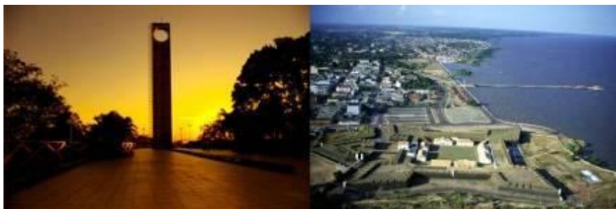
Macapá, capital do Amapá

O local é privilegiado e situado num dos estados do Norte do Brasil. Ali está a única capital do país cortada pela linha do Equador e que não se interliga com as demais por meio de rodovias. Mas isso não é sinônimo de isolamento. Macapá, a capital do Amapá, possui crescimento econômico e populacional acima da média nacional. O ambiente agradável desta cidade é o cenário e palco de atuação do novo associado da RedeJur, o escritório Souza, Santos, Juarez, Lourenço e Advogados Associados.